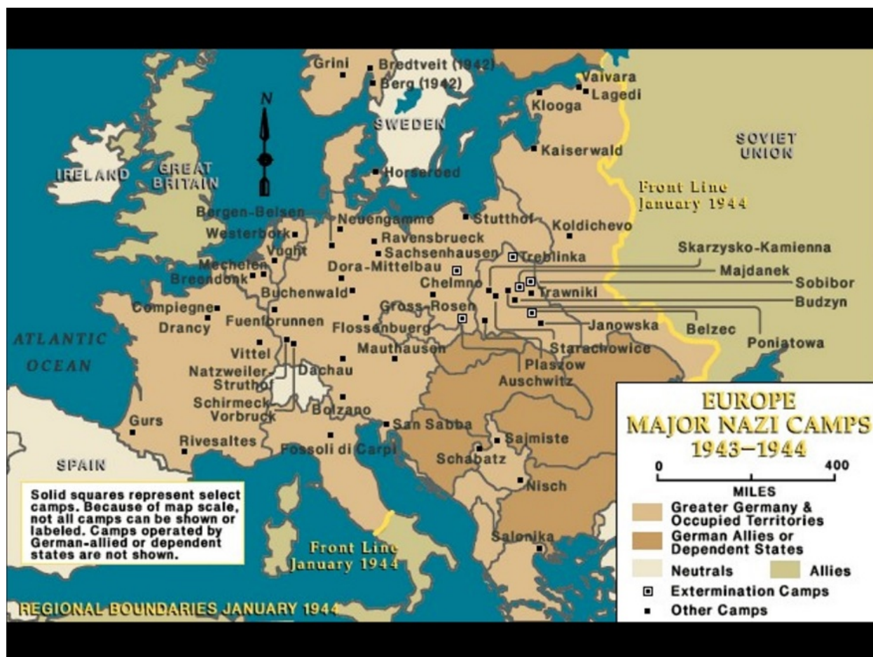
FIGURA #1. USHMM (2017B). PRINCIPALES CAMPOS NAZI EN EUROPA, ENERO 1944.

el caso de la población, la misma incluye el grupo social o étnico al cual esta pertenecía, como judíos, gitanos, prisioneros de guerra, etc. Esto se debe a que un mismo evento se puede experimentar de manera diversa, dependiendo del trasfondo de una persona, sus creencias y experiencias de vida.