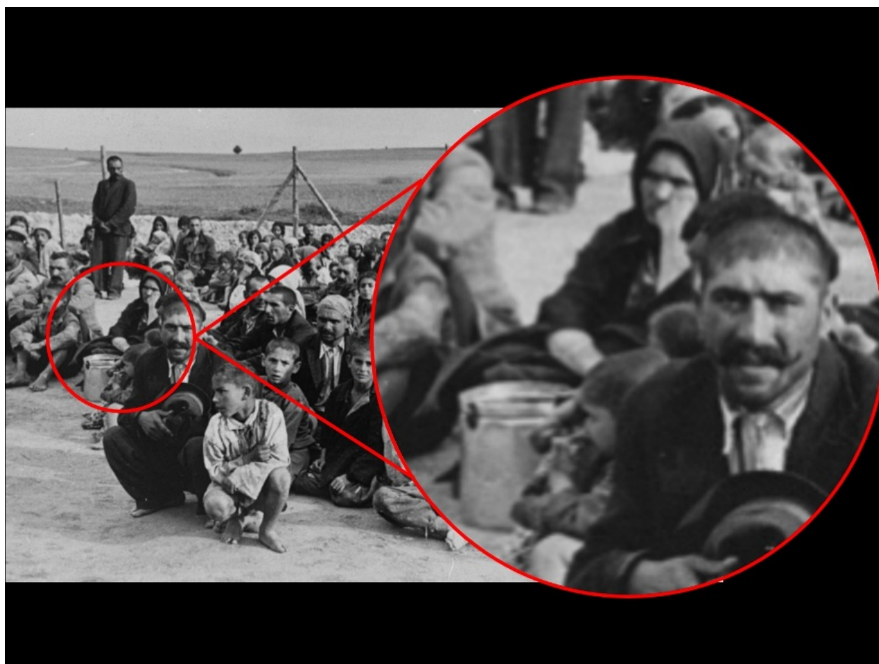
FIGURA #2. USHMM (2005). FOTOGRAFÍA #74705. UN GRUPO DE PRISIONEROS GITANOS, A LA ESPERA DE INSTRUCCIONES POR PARTE DE SUS CAPTORES ALEMANES, SENTADOS EN UN ÁREA ABIERTA CERCA DE LA VALLA EN EL CAMPO DE CONCENTRACIÓN DE BELZEC. MUJER CON CONTENEDOR DE METAL, ACERCAMIENTO.

servía para el transporte de alimentos propios. Es decir, los contenedores representaban una parte importante de la supervivencia en los campos pues era en ellos que se colocaban los alimentos. El comportamiento de la mujer parece ser indicador de que dicho contenedor cumplía realmente con una función asociada a trabajo forzado. Similarmente, la relación entre las personas (en este caso judías) y objetos en la fotografía que fue analizada para el campo de Columbia es una de labor. Los objetos con los cuales están interactuando los individuos en esta fotografía son herramientas de trabajo.