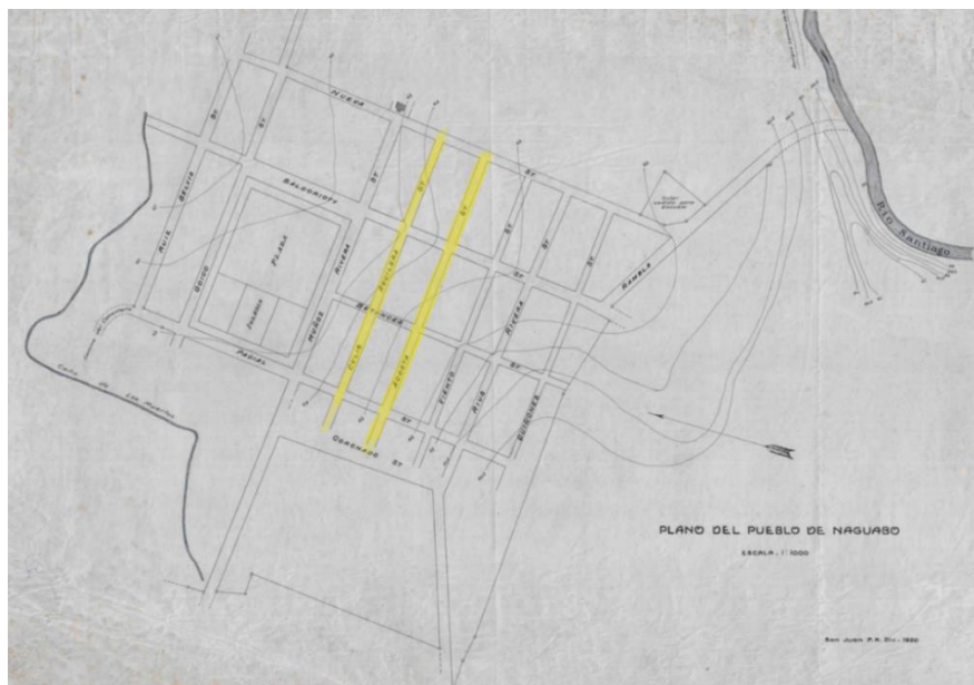
FIGURA 2: PLANO DEL PUEBLO DE NAGUABO, 1920