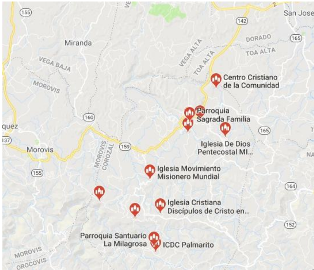
FIGURA #4: MAPA DE LAS IGLESIAS CRISTIANAS EN COROZAL, PUERTO RICO.

Una de las interrogantes más importantes del estudio fue si existía una relación entre los servicios que ofrece la funeraria y los rituales religiosos que en cada una de ellas se practican. La respuesta obtenida por parte del personal a cargo en la Funeraria Hernández fue que, “[ésta] siempre es a discreción de los intereses de las personas para evitar cualquier malentendido.” La respuesta recopilada en la Funeraria Berríos se ciñó al carácter eminentemente económico de la empresa, enfatizando en su respuesta, que “[ninguno], ...lo de nosotros es vender el servicio funeral, ya lo otro que se encarguen los familiares”. Por otra parte, el diácono católico expresó que “...[las] funerarias por lo general nos llaman, ya que muchas veces las personas desconocen ... cómo solicitar el servicio y ahí ellos se comunican con nosotros.”. Advirtió, además “...que casi siempre los familiares eran los que se comunicaban y hacen la solicitud del servicio”. El personal entrevistado en la Funeraria Hernández respondió de una manera similar indicando que son los familiares de la persona fallecida quienes hacen la petición o gestión sobre el rito y servicio religioso que se desea. Esta aseveración nos permite observar que existe una relación entre la funeraria como empresa y espacio, y los servicios religiosos que se