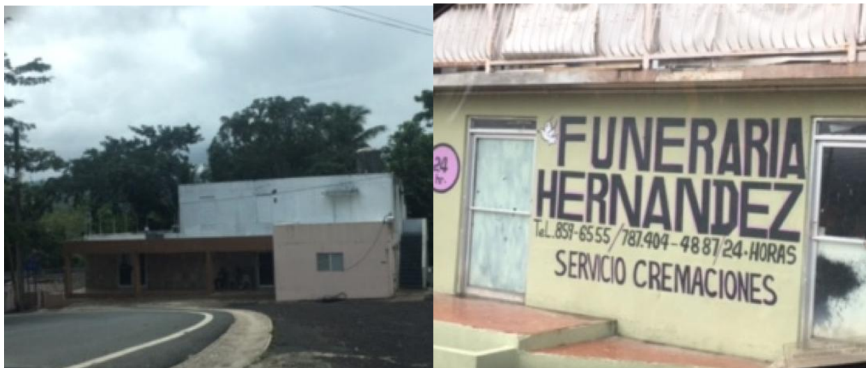
FIGURA #2: ENTRADA PRINCIPAL Y FACHADA DE LA FUNERARIA HERNÁNDEZ.

Sistema de Bibliotecas del Recinto de Río Piedras de la Universidad de Puerto Rico. Para tener una contextualización de las variables culturales, a partir de las creencias religiosas predominantes en la región de estudio, se realizó un mapa etnográfico. Este consistía en la localización de las iglesias (representativas del catolicismo/protestantismo) alrededor del pueblo de Corozal. El mapa y todas sus representaciones como modelo simplificado de la realidad, puede ayudar en la búsqueda de elementos etnográficos de una zona, la distribución espacial de unos indicadores físicos (eje. edificación, caminos) y humanos (eje. movilidad, tránsito, vivencias) en ese territorio y de esta forma aportar a las técnicas de representación cartográfica y al enfoque antropológico. (Carrera Díaz, 2007: 73-75)