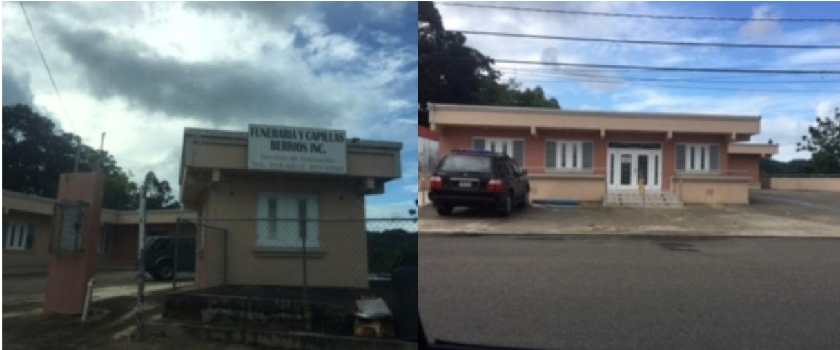
FIGURA #3: ENTRADA PRINCIPAL Y LATERALES DE LA FUNERARIA BERRÍOS.

tarea de escoger una persona representativa de los servicios religiosos que se ofrecen. Corozal es un pueblo históricamente cristiano, siendo el catolicismo la religión con una visibilidad más longeva. No obstante, el protestantismo cristiano y sus variantes tienen una importante presencia, particularmente, la tradición evangélica y pentecostal. Coexiste la posibilidad de que haya constancia de otras religiones y prácticas en la municipalidad, pero éstas no fueron objeto de este estudio.